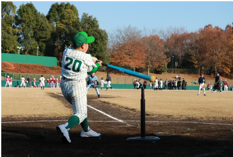
2017年12月3日 第11回所沢市民・早稲田大学交流ティーボール大会の様子

北秋津ビクトリーズでは、コーチが日本ティーボール協会主催の講習会を受講して公認指導者の資格をとり、チームの練習に取り入れています。初めてやる人でも楽しくプレーできるティーボール、みなさんも体験してみませんか？